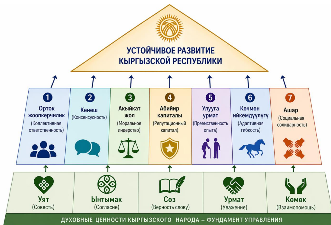
Рис. 1 – Структурная модель кыргызской системы менеджмента

Несмотря на урбанизацию и постсоветскую трансформацию, указанные механизмы сохраняют значительную витальность. Этнографические экспедиции ИСА НАН КР (2019-2022) фиксируют регулярное самоорганизующееся использование «ашара» в сельских общинах юга. Исследование Центральноазиатского барометра показывает, что уровень межличностного доверия (53%) существенно превышает институциональное доверие к парламенту и правительству. Этот разрыв отражает не «архаичность» общества, а наличие параллельной инфраструктуры координации, работающей надежнее формальной. Эти сохранившиеся механизмы образуют основу для построения структурной модели кыргызской системы менеджмента (рис. 1). Предлагаемая модель выстроена в логике трехуровневой архитектуры: (1) ценностное ядро, образованное пятью базовыми духовными категориями; (2) принципиальный уровень, включающий семь управленческих принципов, выводимых из ценностей и переводимых на язык организационных процедур; (3) инструментальный уровень – конкретные практики, регламенты и инструменты, опосредующие реализацию принципов в конкретных организационных контекстах.