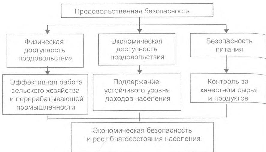
Рис. 3.3.1. Основные структурные компоненты продовольственной безопасности

А чтобы обеспечить это наличие и возможности, необходимо, естественно, устойчивое развитие отечественного производства, достаточное для обеспечения продовольственной независимости данного государства.