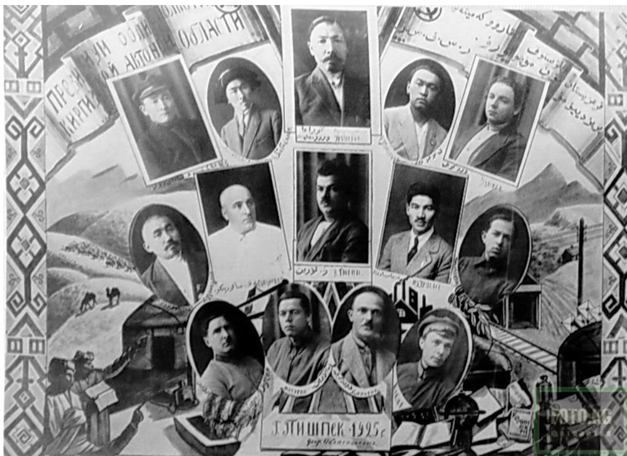
Кыргыз автономиялык облусунун Революциялык комитетинин президиуму. Сүрөт: 1925-жыл