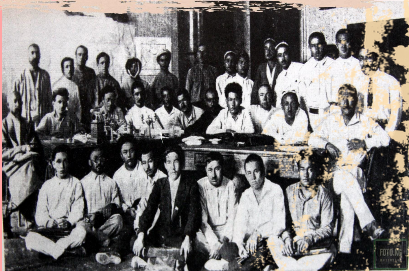
Улуттук-аймактык чектөө боюнча Түркстан комиссиясынын кыргыз бюросу. Ортодо Ж. Абдрахманов отурат. Сүрөт: 1924-жыл

Жусуп Абдрахманов, 1920-жылдардын башында Абдыкерим Сыдыков, Ишеналы Арабаев жана башкалар менен бирге Түркстан Республикасынын курамында тоолуу облус түзүү сунушун киргизген. 26 жашында Кыргыз АССРинин Эл Комиссарлар Кеңешинин Төрагасы болуп дайындалган. Анын жаштыгы жана энергиясы жаңы мамлекеттүүлүктүн жаралышына түрткү болду.