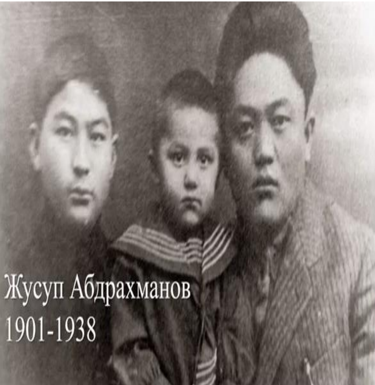
Жусуп Абдрахманов 1901-1938

Качкындар ач-жылаңач, оор абалда болушкан. Алар жардамга муктаж эле.