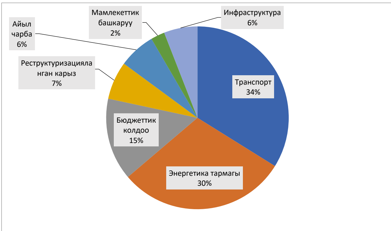
Сүрөт №3.8. Тышкы карыз (көп тараптуу) 3